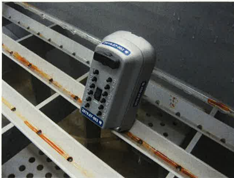
図 カギ番人プラスPS12